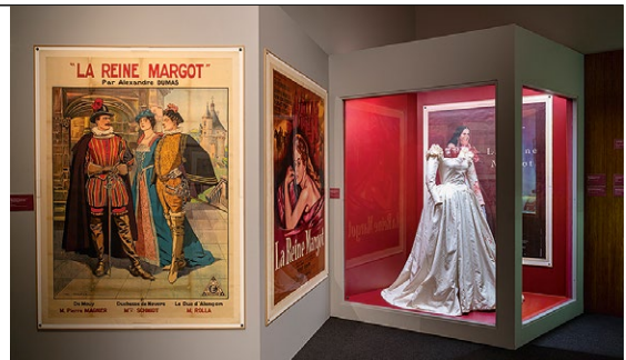
NICOLAS WIE TRICHW